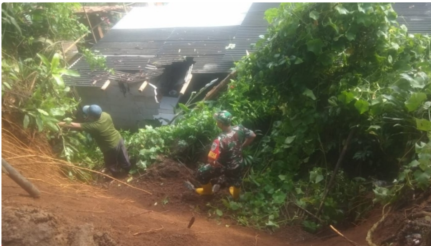
Babinsa Koramil 0622-04/Cikidang Cek Longsor di Wilayah Desa Pangkalan Kecamatan Cikidang Kabupaten Sukabumi

Sukabumi - Babinsa Desa Pangkalan bersama Pemerintah Desa, Babinkamtibmas, dibantu warga setempat telah mengecek lokasi tanah longsor akibat curah hujan yang tinggi dengan (lebar : 4 meter, tinggi 5 m) yang terjadi akibat intensitas hujan tinggi, longsor tersebut terjadi pada hari Minggu 13 November 2022 hari kemarin.